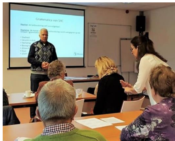
Social Haptic Communication Gastspreker Bartiméus

Als je bijvoorbeeld glaucoom op tijd kunt herkennen en signaleren, dan kan tijdige behandeling gezichtsveld en zichtverlies voorkomen. Dat is ongelooflijk dankbaar en waardevol. Ik denk dat je als ouderenadviseur zeker zo'n training gedaan moet hebben'.